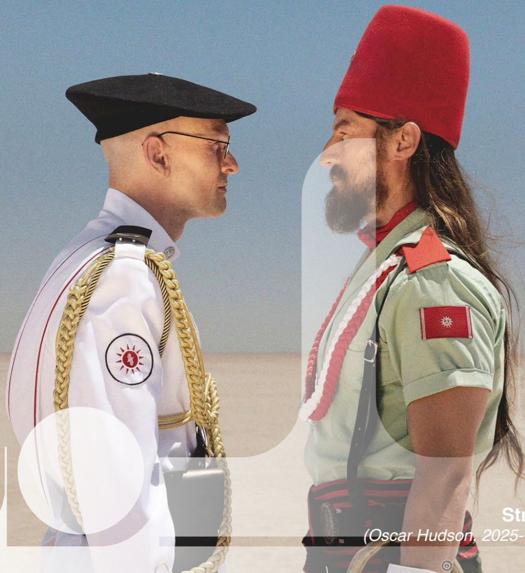
Straight Circle (Oscar Hudson, 2025- Royaume Uni)

La majorité des réalisateurs et certains acteurs seront présents aux projections